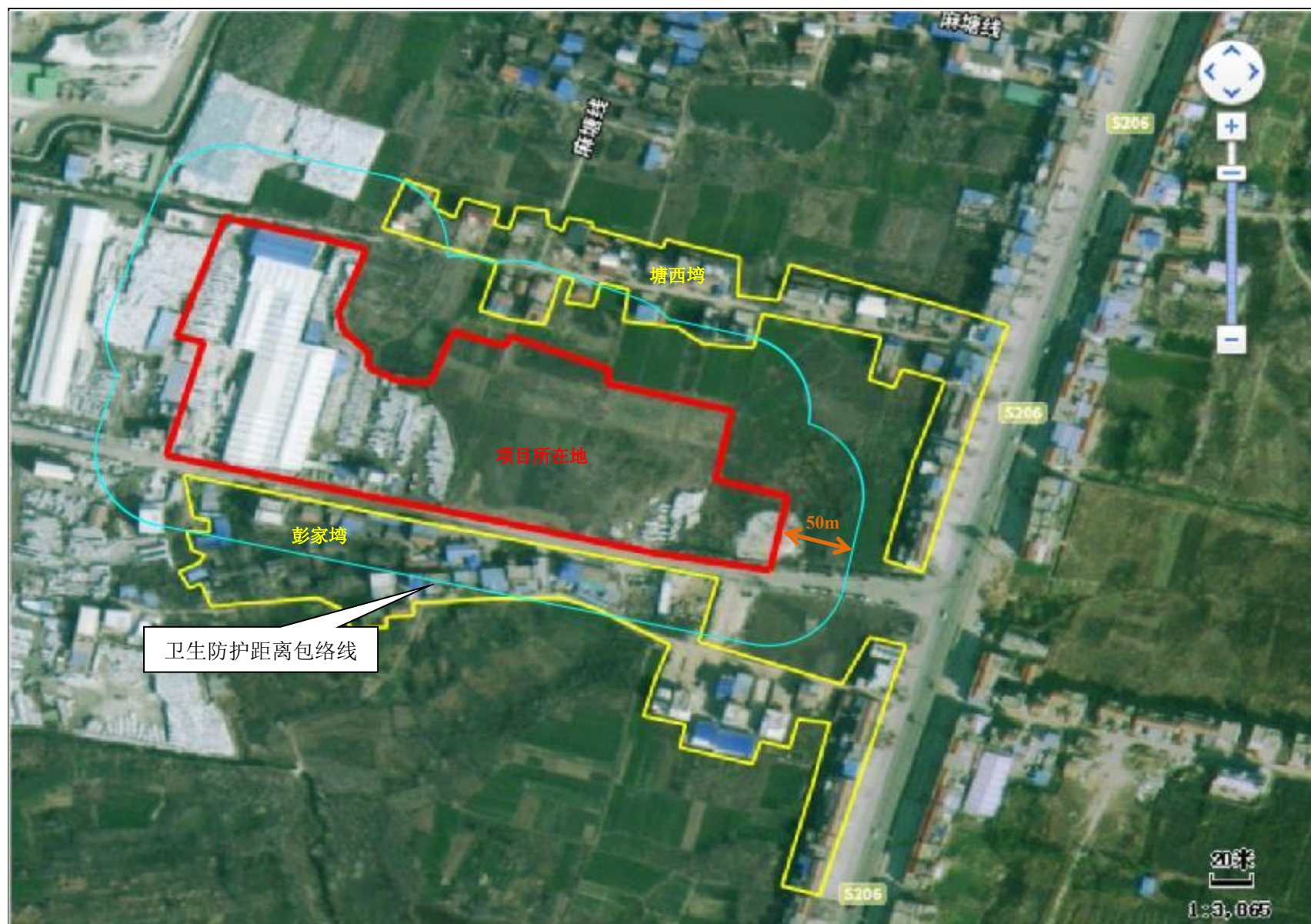
附图 5 项目卫生防护距离包络线图